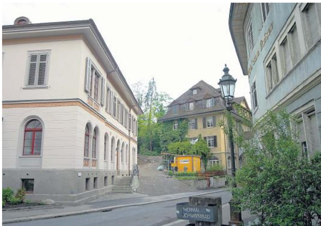
BAUPLÄNE Hinter «Ochsen»-Dépendance, in jener des «Bären» (Mitte) und im Verenaahofgeviert. W. SCHWAGER

Der Tessiner Stararchitekt steht nun auch im Vordergrund, um den «Verenaahof» wieder aufblühen zu lassen. Botta's Studie sieht den Hoteltrakt in einem kegelförmigen Aufbau an der Spitze des Verenaahofgevierts vor. Damit würde eine neue Visitenkarte bei der Einfahrt ins Bäderquartier entstehen, hob Zehnder die Vorzüge des Entwurfs von Botta hervor. Ob dieser realisiert wird, würden letztlich die Betreiber des neuen «Verenaahofs»