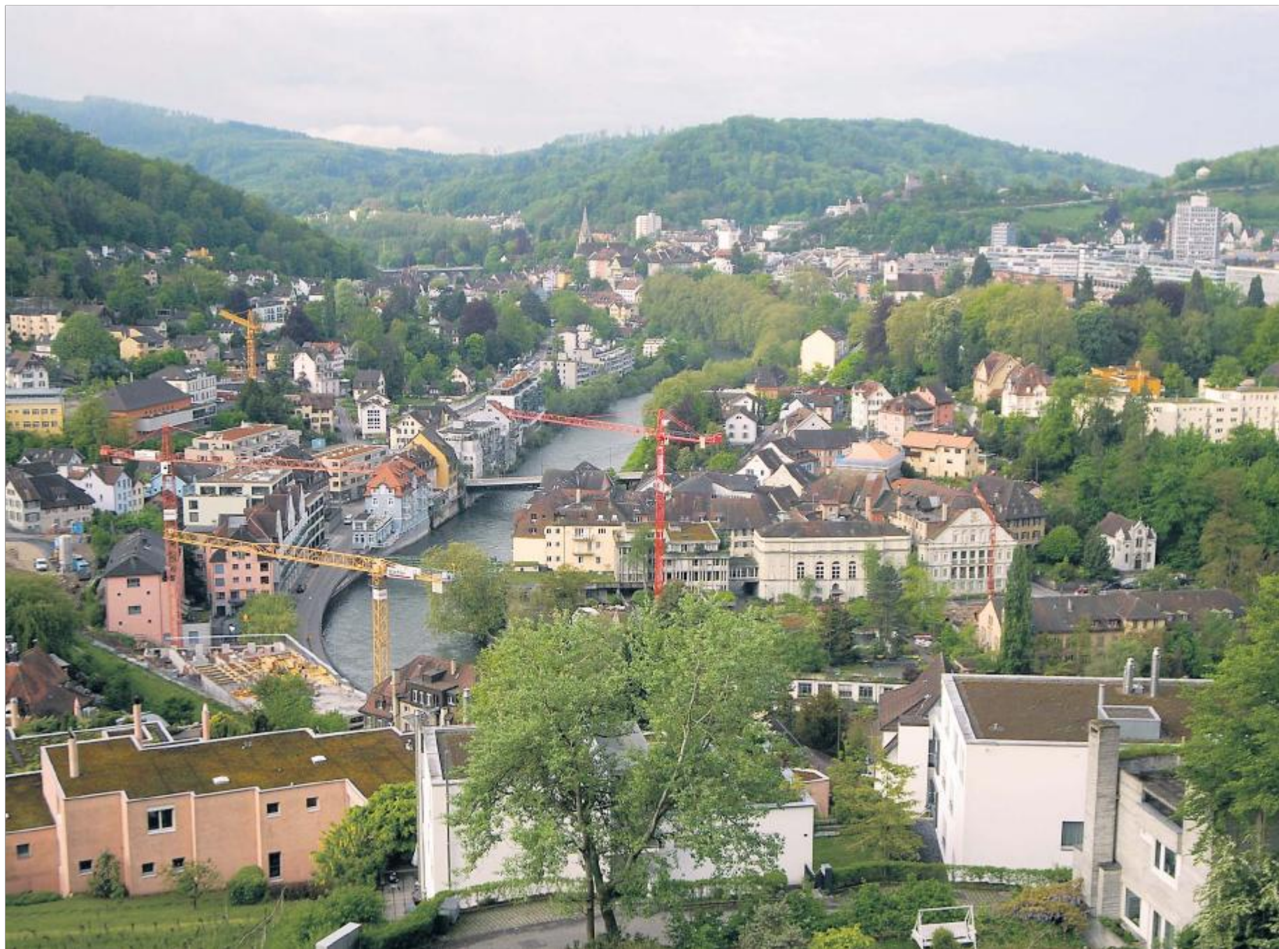
BLICK AUFS BÄDERGEBIET In Ennetbaden (links) wächst die neue «Hirschen»-Residenz empor, auf Badener Seite stehen vorläufig noch die Kräne der Archäologen. WALTER SCHWAGER

Man sei bereits zur Durchführung des Studienauftragsverfahrens für die neue Therme von den Plangrundlagen abgewichen, «und wir werden das auch in Zukunft wieder tun», erklärte Wiederkehr mit Verweis darauf, dass die Vorschriften präzise, aber nicht zu eng sein und die Fortsetzung der begonnenen Entwicklung erlauben sollten. So soll etwa der kleine Park neben dem heutigen Thermalbad aus dem Schutz entlassen und in die Bäderzone überführt werden, damit dort im Limmatknie neu ein Wohn- und