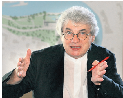
Architekt Mario Botta.

ein Restaurant vorgesehen. Die Denkmalpflege habe keine Einwände gegen diese Entwürfe geäussert, sagt Zehnder. Die bereits in stand gesetzte neubarocke Ochsen-Dépendance eingangs des Bäderquartiers bezeugt, dass Zehnder nicht der Schaumsträger ist, für den ihn manche Badener hielten. Die vielen geplatzten Pläne rund um die Wiederbelebung des einst international angesagten Bäderquartiers haben sie miss-